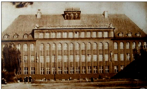
Gimnazjum i Liceum im. B. Limanowskiego

Warunki były bardzo ostre: dobre ostatnie świadectwa, kontrolne wstępne egzaminy w ciągu pierwszych dni nauki i eksternistyczne egzaminy maturalne. Warunki oczywiście przyjęliśmy, bez zbędnej zwłoki zameldowaliśmy się na pobyt tymczasowy we Wałbrzychu i zabraliśmy się pilnie do nauki.