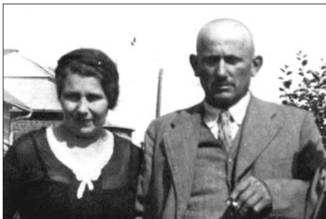
Rodzice w Monasterzyskach

Córeczka była prześliczna, pełna życia i pięknie śpiewała. Oczywiście podkochi-